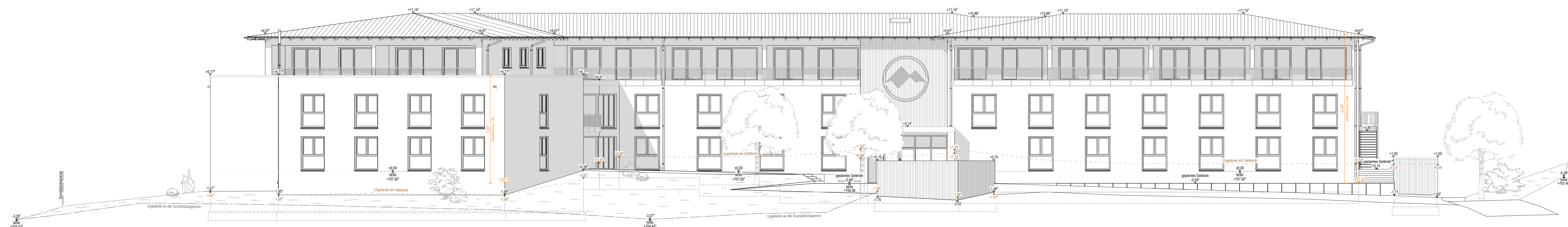
Ansicht von Süden